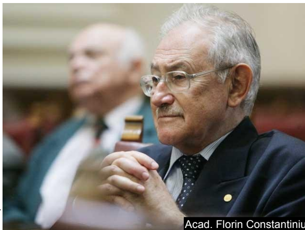
Acad. Florin Constantiniu

Românii - și nu numai, au fost în primul rînd trădați de clasa lor conducătoare. Fosta clasă conducătoare – nomenclatura – a socotit în 1989 că a venit momentul să se transforme dintr-o clasă dominantă de facto într-una dominantă și de jure . Înainte de 1989 accesul lor la resurse (financiare, economice) nu era sigur: lipsea statul de drept care să le garanteze proprietatea privată. Să ne amintim că nicăieri partidele comuniste nu au fost înlăturate de la putere prin revoluții populare, ci peste tot – inclusiv în România – ele au părăsit puterea prin trădarea liderilor, prin trădarea nomenclaturii care a considerat că a sosit momentul îmbogățirii. Oare nu Gorbaciov a lansat campania de demolare a economiei socialiste prin perestroika lui catastrofală? Oare nu peste tot capitaliștii s-au format în principal din foștii nomen-