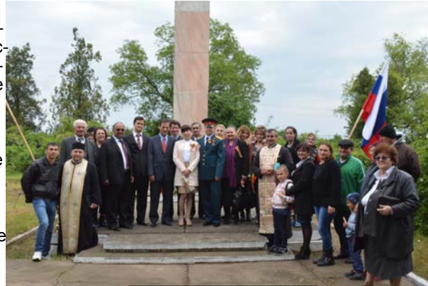
9 mai 2016 Budești

de arme și muncă grea. Eroismul și spiritul de sacrificiu, manifestate de generația timpurilor acestui război, vor rămîne pentru noi drept (continuare în pag. 11) →