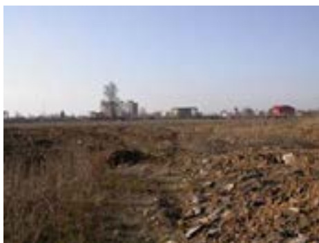
Ruinele Întreprinderii „Autobuzul”

Imaginea locului în care a fost Întreprinderea „Autobuzul” din București este sinistă. În anul 2015 nu mai există decît cîteva ziduri unde era poarta de intrare, în rest este cîmp deschis plin de buruieni și arbuști, seamănă cu un zăvoi. O imagine dezolantă ca după un război, dar nu unul clasic ci un război economic pe care, din păcate, l-am pierdut.