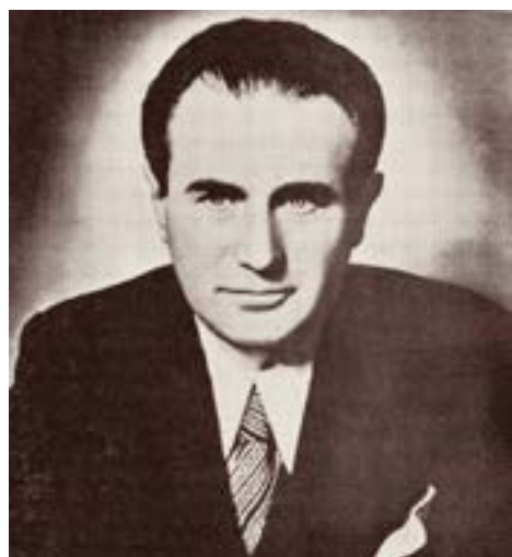
Camil Petrescu (22.04.1894-14.05.1957)

În capitalism, cei care au un loc de muncă se pot considera norocoși. Dar există o categorie de oameni, șomerii, care ar da orice să poată munci, în orice condiții.