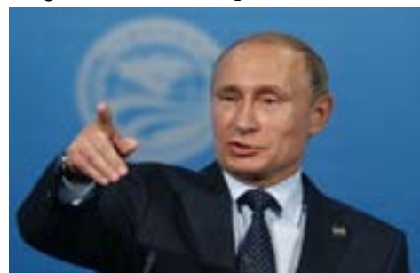
Vladimir Putin, președintele Federației Ruse

Agențiile de știri, cu toate înclinațiile lor „pro” sau „contra” – explicabile, de altfel! – rămîn singura sursă de informare pentru cei care doresc să-și construiască o imagine de ansamblu plauzibilă, obiectivă,