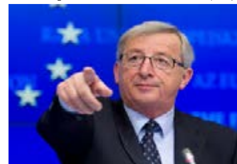
Jean-Claude Juncker, președintele Comisiei Europene

ilustrate prin cazuri reale mai mult sau mai puțin regizate – toate menite să-i zugrăvească pe refugiați în cele mai sumbre nuanțe posibile. Pornind de la acest curent de opinie - merită parcă să resusciteze în conștiința