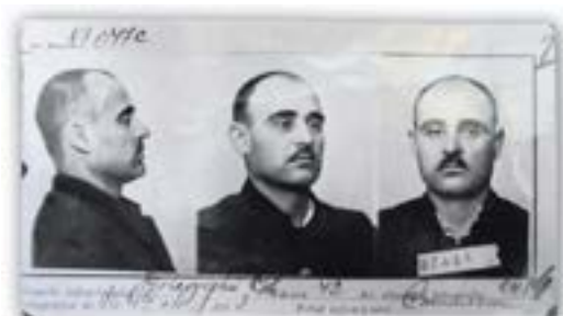
Gheorghe Gheorghiu-Dej (primul lider comunist al României) - deținut politic în 1943. Felul infracțiunii: „Comunism”

capitală întruniri și congrese? Chiar duminica trecută sindicatul proprietarilor nu numai că s-a întrunit la „Dacia”, dar a manifestat și pe străzi, cu tot regimul stării de asediu. Social-democrații nici ei nu sunt