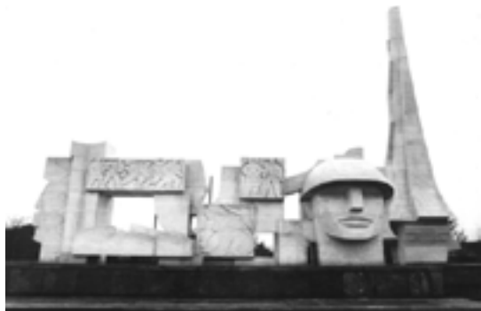
Complexul memorial monumental din Carei

angajați nemijlocit în luptă, între 23 august și 25 octombrie 1944. Dintre aceștia, au fost uciși sau