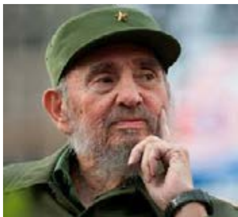
Fidel Castro Ruz

D uminica este o zi bună pentru a citi ceea ce ar părea SE. Se anunță că CIA ar fi declassificat sute de pagini despre acțiunile ilegale care cuprindeau planuri de eliminare a liderilor de guverne străine. Dintr-o dată este oprită publicarea lor și se întârzie o zi. N-au dat nici o explicație coerentă. Poate cineva de la Casa Albă a răfoit materialul.