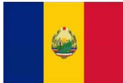
Republica Socialistă România

La manifestările sportive internaționale, imnul „ Te slăvim, Românie! ” a răsunat în nenumărate rânduri, ori de câte ori sportivii