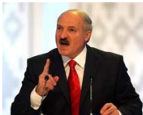
Președintele Belarus - Alexandr Lukașenko

Îată că au trecut 25 de ani, sau să spunem cinci cincinale, de când România a trecut la capitalism. Bilanțul s-a făcut de nenumărate ori, și îl face fiecare român care trece prin viață cu ochii deschiși. Cele mai elocvente comparații sunt între primii 25 de ani de socialism și primii 25 – și deja nepermis de mulți – de capitalism restaurat. Având în vedere că prăbușirea socialismului în partea aceasta de lume a fost practic totală e greu