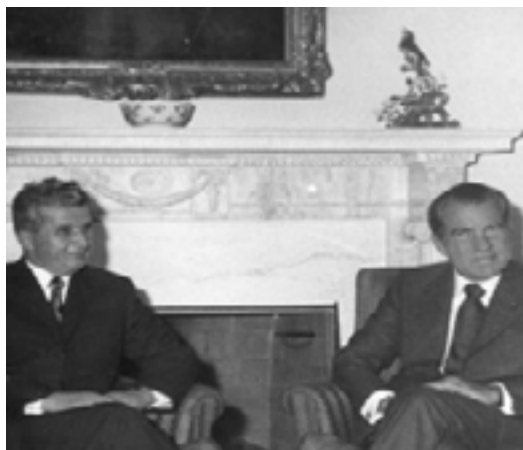
Nicolae Ceaușescu și Richard Nixon, președintele SUA, în 1973

de sine stătător, linia politică, obiectivele concrete, căile și metodele atingerii acestora, aplicând creator adevărurile generale ale marxism-