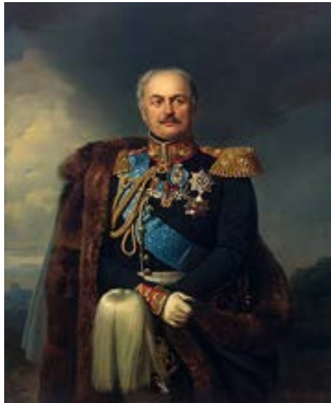
Pavel Dimitrievici Kisseleff Guvernator al Moldovei și Munteniei, noiembrie 1829-aprilie 1834

P oți să te ridici împotriva rușilor, al căror păcat capital constă în dorința de a izola țara, spre a o supune influenței exclusive a Petersburgului, dar nu poți uita – fără să