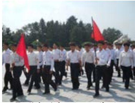
Tineri îndreptându-se către o manifestație

punct de vedere etnic, aceștia vorbesc limba coreeană, varianta HANGUL și folosesc