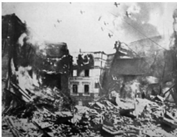
Avioane americane bombardând Bucureștiul

ceva mai sus, pe Calea Victoriei, am văzut fumegând hotelul Splendid, aproape complet dărâmat, pe trotuare numai sticlă sfărâmată de la vitrinele magazinelor distruse de suflul bombelor. În spatele Ateneului devastat, mai fumega locul expoziției Comitetului de Patronaj. În sus, pe Calea Victoriei, pe stânga