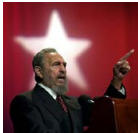
Fidel Alejandro Castro Ruz

„ Și pentru această revoluție a oamenilor simpli, pentru oamenii simpli și prin ei, suntem dispuși să ne dăm viața ”, a spus la 16 aprilie 1961, în fața unei mulțimi de cubanezi îndurerați, care însoțeau pe