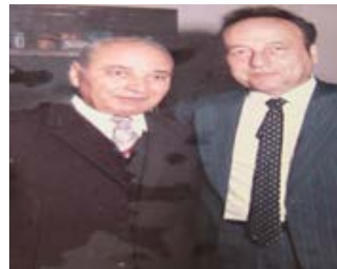
Gh. Apostol împreună cu Ștefan Andrei - Ministru al Afacerilor Externe

A fost prim-vicepreședinte al Consiliului de Miniștri (Guvern) între anii 1952-1954 și 1961-1967.