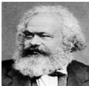
Karl Marx, 1872

Constatăm astăzi că, în cea mai mare parte, cele spuse de Marx sunt în continuare valabile. Evident că nu tot ce a spus Marx s-a adeverit, evident că nu tot ce a spus Marx în secolul XIX mai este valabil și azi. Însă principiile de bază ale marxismului, principii cum ar fi rolul exploatator al TUTUROR capitaliștilor, fără excepție, principii cum ar fi pauperizarea crescândă a celor ce