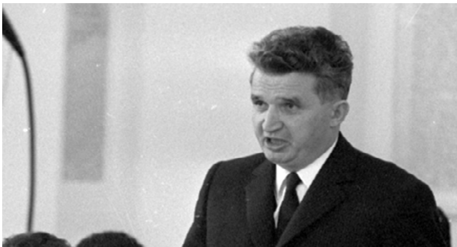
Nicolae Ceaușescu, Președintele Republicii Socialiste România

îndreaptă spre o direcție greșită, în timp ce 69% sunt de părere că era mai bine pe vremea lui Ceaușescu. Visul european al multor români s-a transformat într-un coșmar