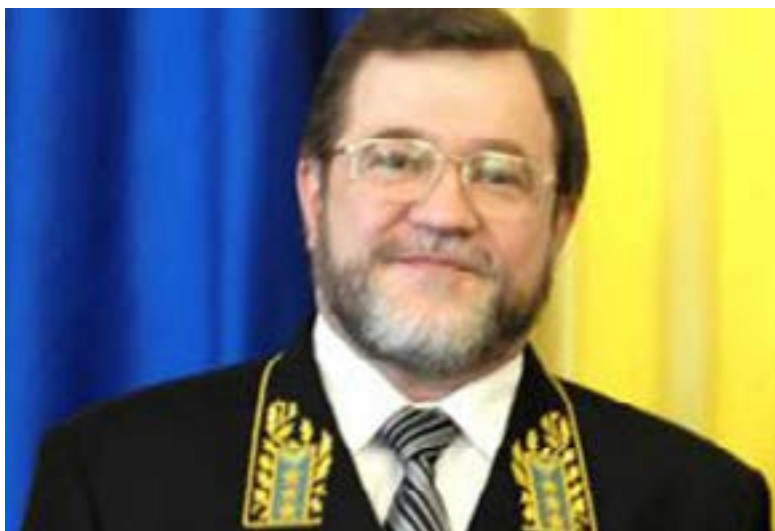
E.S. Oleg Malginov, Ambasadorul Federației Ruse la București

„Dragi veterani-comatanți, stimate doamne, stimați domni!