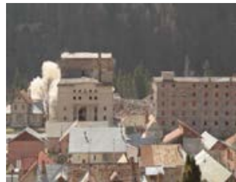
Fabrica de Bere Azuga în ruină