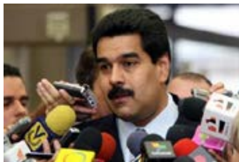
Nicolas Maduro Momo, Președintele Venezuelei