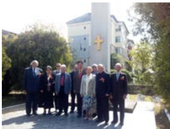
Ziua Victoriei la Târgoviște - 2014

Astăzi ne înclinăm cu toții față de ostașii-