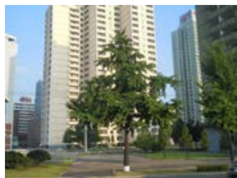
Cartier de locuințe în inima Phenianului

Inaugurată pe 15 aprilie 1951, evident, o dată cu o aniversare a lui Kim, statuia are o înălțime de 46 de metri și este lucrată din peste 2.500.000 de blocuri de granit, având 360 de forme și mărimi diferite. Legendele coreene spun