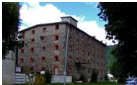
Fabrica de Bere Azuga în ruină

Într-o societate în care , pentru a se justifica lipsurile din spitale prin pretextul că „este zi de post” , într-o societate în care, în numele democrației se