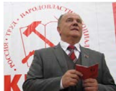
Ghennadi Adreevici Ziuganov, Prim-secretar al PCFR

Alte strategii ale comuniștilor se referă la